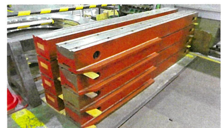
張り出し角リブ8本