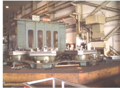
5面パレットチェンジャー